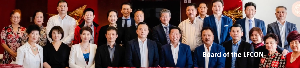
Board of the LFCON